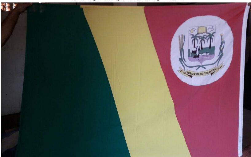
IMAGEM 08 TOCANTINS