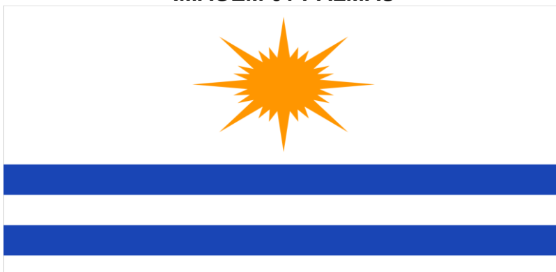
IMAGEM 02 BREJINHO DE NAZARÉ