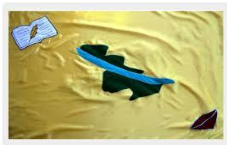
IMAGEM 05 LAJEADO