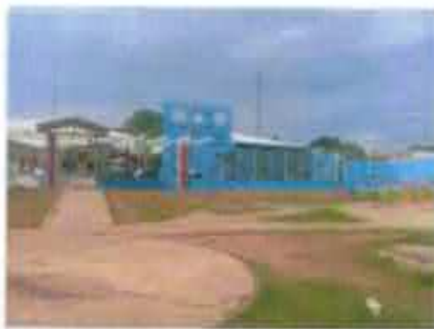
Centro Municipal de Educação Infantil Taquaralto da Aldeia.

em 2018 foram feitas 87 matrículas, ainda há 13 vagas disponíveis para as famílias dessa comunidade. Também existe na rede no Bairro de Taquaralto o Centro Municipal de Educação Infantil Miudinhos e o Sonho de Criança.