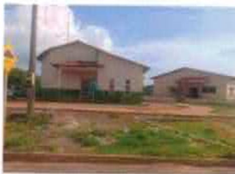
Rev. Construção de Segurança de Palmas: P-1 da URBANIZAÇÃO 01 2019

se de bairros próximos. A política de mobilidade e segurança será estendida às famílias beneficiárias por meio de parceria entre a guarda metropolitana e as demais instituições de segurança.