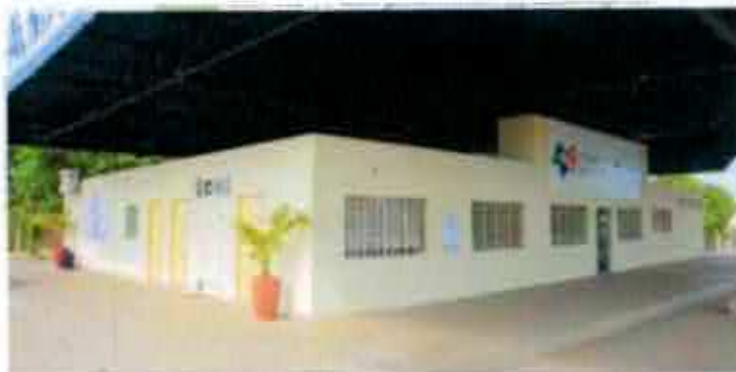
Estação Juventude do Setor Santa Bárbara

A Estação Juventude do Setor Santa Bárbara, fica na Rua 01, Quadra 08, Lote 27, no Setor Santa Bárbara, desenvolve diferentes projetos, o objetivo central é um espaço para o desenvolvimento social dos adolescentes e jovens, da promoção das políticas públicas de Juventude de Palmas. Para isso conta com um quadro de profissionais selecionados com qualificação nas diversas áreas sociais para um perfeito desenvolvimento das atividades que são ofertadas.