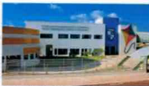
Colégio Esportivo Militar do Corpo de Bombeiros (CEMIL) Profª. Margarida Lemos Gonçalves

Cita-se ainda o Colégio Esportivo Militar do Corpo de Bombeiros (CEMIL) Profª. Margarida Lemos Gonçalves, que fica localizada no Setor Lago Sul, APM 11, Rua João Pires Querido Filho, Palmas-TO, que atende as demandas oriundas do empreendimento habitacional Ipê Amarelo. No CEMIL a estrutura é para tempo integral, com quadra poliesportiva coberta, auditório, teatro, refeitórios, banheiros adaptados, biblioteca, área de lazer, piscina, salas de aulas climatizadas, entre outros. Sua capacidade de atendimento é para 1.034 alunos, em 2018 foram matriculados 1022 alunos, tendo 12 vagas disponíveis à comunidade local. Ensino é distribuído do 2º ao 9º ano do ensino fundamental, os estudantes têm, além das disciplinas tradicionais, treinamentos nas modalidades de xadrez, futsal, handebol, tênis de mesa, atletismo, judô e natação. Além do treinamento desportivo, o sistema educacional da unidade conta também, com disciplinas militares como civismo e primeiros-socorros ministradas pelo Corpo de Bombeiros. Foi inaugurado em fevereiro de 2016.