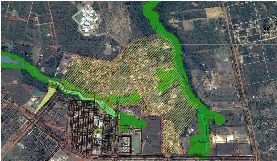
Figura 01 - Área de Estudo Lago Norte

O loteamento possui escassos serviços de infraestrutura básica, servido apenas pela coleta de lixo, abastecimento de água potável, energia elétrica e iluminação pública. O acesso à área dá-se principalmente pelas NS – 8 e Alameda 12 do setor Santo Amaro.