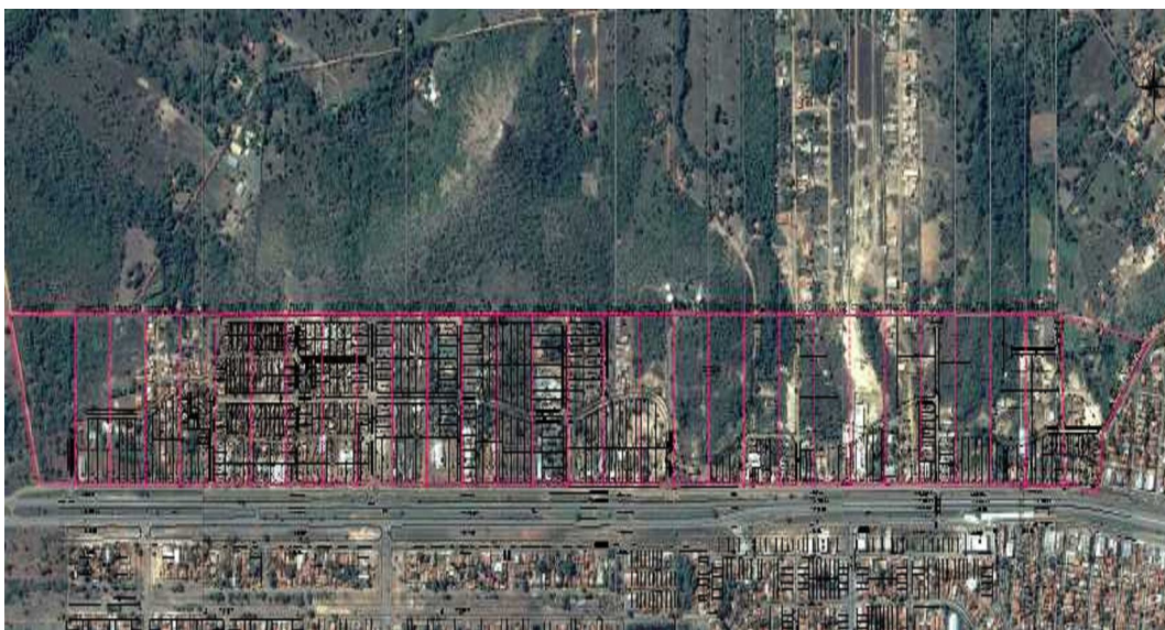
Figura 03 - Área de Estudo Taquarussu 2ª Etapa

Possui escassa infraestrutura básica, servido apenas pela coleta de lixo, abastecimento de água potável, energia elétrica e iluminação pública. O acesso à área dá-se principalmente pela TO – 050.