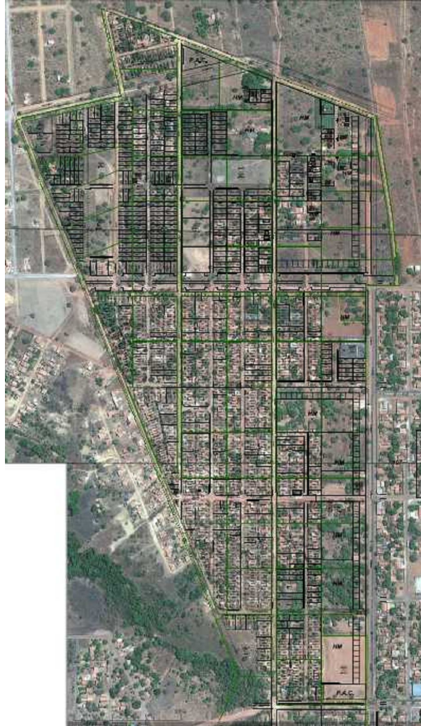
Figura 02 – Área de Estudo Irmã Dulce

abastecimento de água potável, energia elétrica e iluminação pública. O acesso à área dá-se principalmente pela avenida D e Rua 09 do Aurenly IV.